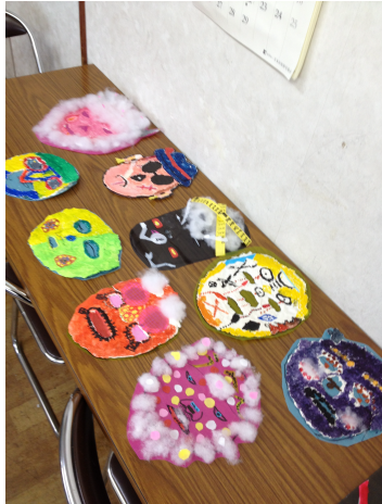
長尾教室／個性あふれるおめんたち