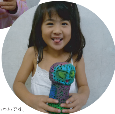
長尾教室 ことのちゃん(1年生) 独創的なはねの模様や カラフルな色使いが とっても個性的。 明るく華やかなふくろうちゃんです。

11月は彫刻に挑戦！とアレンジフラワーなどに使う給水スポンジ(オアシス)を使った彫刻を行いました。平面からの版画などと違い、横、上、後ろなどのつながりがずいぶん難しかったようで「横から見たらどうなるんかわからない〜！」「丸くするの難しいなあ」と悪戦苦闘していましたが、幼児さんは「カラフルな魚」、小学生は「ふくろう」とそれぞれ集中して取り組むことができました。